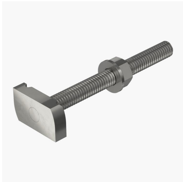
Vis à tête marteau pour rails profilés MS4121 et MS4141