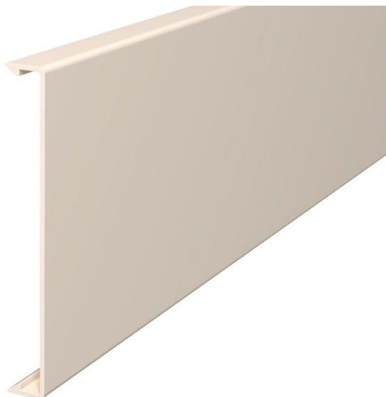
Couvercle pour l'obturation des goulottes.